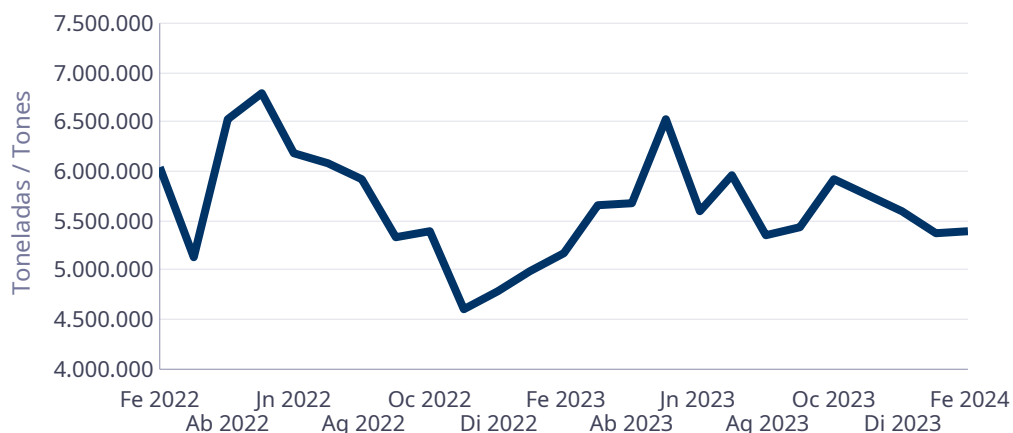
Evolución mensual del tráfico de mercancías en el Puerto Autónomo de València Evolució mensual del trànsit de mercaderies al Port Autònom de València