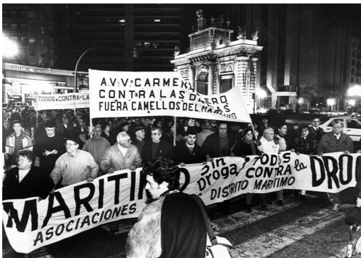
Fotografia 4. Protesta veïnal contra el tràfic de drogues al centre de València