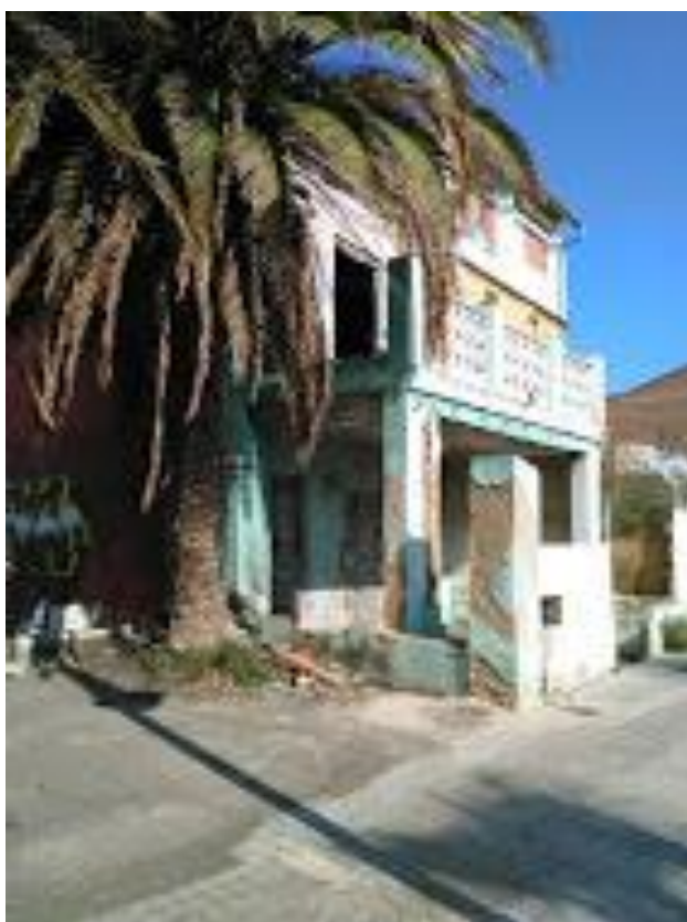
Cases al carrer d'Eugènia Viñes, juliol de 2015