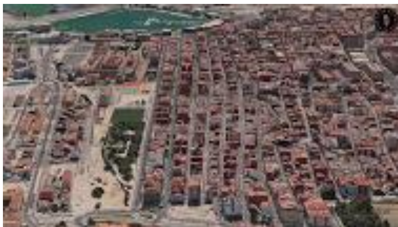
Vista aèria del barri del Cabanyal-Canyamelar

El Cabanyal ha tingut una consideració molt important de poble pel seus propis pobladors que es manté fins els nostres dies. Això ho podem veure en expressions com “me'n vaig a València”, en la relació de les persones, que es coneixen totes entre si, o com els edificis més emblemàtics del barri encara són referent de la vida veïnal: l'església, el mercat, el casino, l'existència de festes i rituals propis com la Setmana Santa Marinera, falles molt participatives... Fins i tot l'entramat del barri, de carrers perpendiculars i paral·lels a la mar diferents de la resta de la ciutat, que va créixer en cercles concèntrics. Tot això ha fet que perdurara com un barri molt diferenciat de la resta de la ciutat.