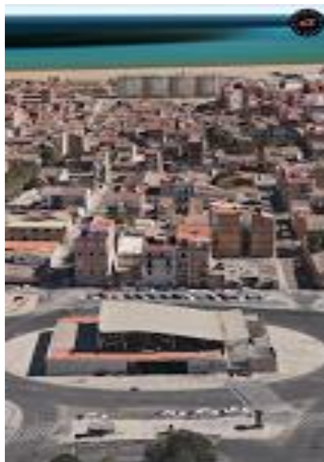
Foto aèria de la zona afectada pel PEPRI, des de l'estació del Cabanyal fins als blocs portuaris

El dia 30 de juliol, el Ple de l'Ajuntament va acordar, amb el suport de tots els grups polítics a excepció del Partit Popular, demanar a la Generalitat Valenciana la derogació del PEPRI. Amb aquesta acció es tancava una part fonamental del conflicte i s'obria una etapa de rehabilitació.