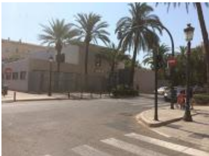
CMAPM, Centre Municipal d'Activitats per a Persones Majors. Cabanyal-Canyamelar, juliol de 2015