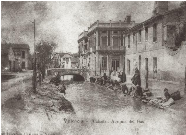
Séquia del Gas al Cabanyal, any 1906. Actualment, avinguda del Mediterrani, des del carrer del Doctor Lluch.

barri seguirà des d'aleshores aquest plantejament, en estreta relació amb el creixement continu del port.