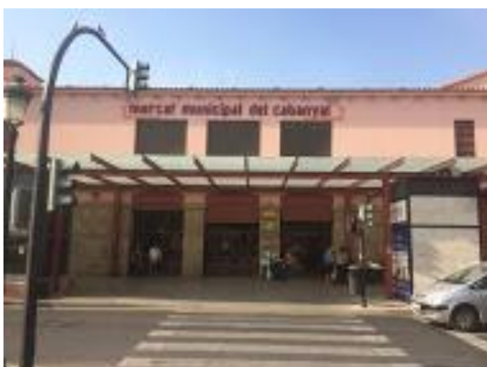
Mercat municipal del Cabanyal, juliol de 2015