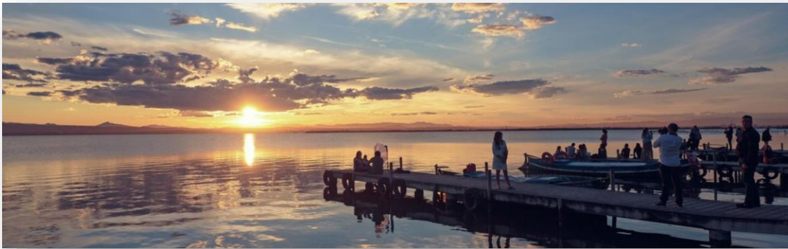
FOTOS 7 Y 8. Embarcadero y mirador de la Gola del Pujol. Vistas del atardecer