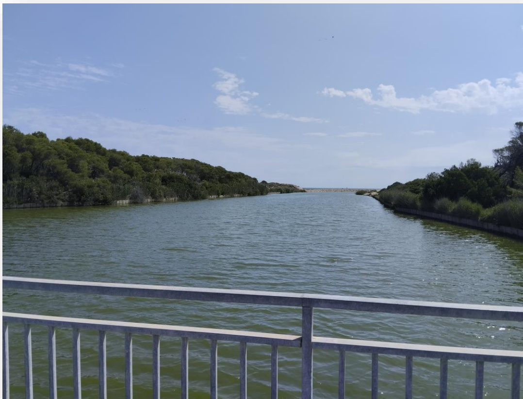
FOTOS 3 Y 4. La gola del Pujol