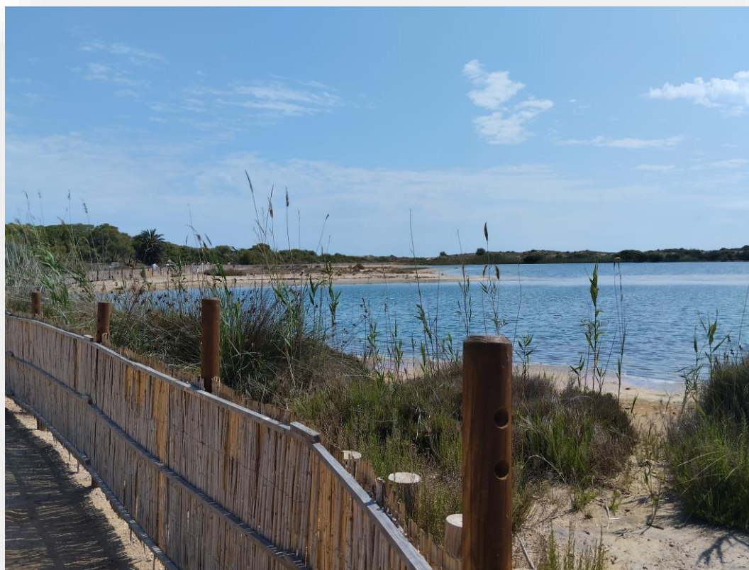
FOTOS 1 Y 2. El lago o estany del Pujol