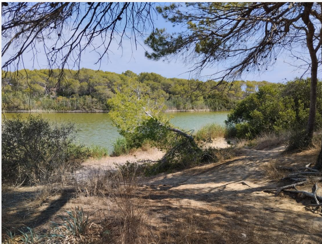
FOTO 6. Vista del entorno