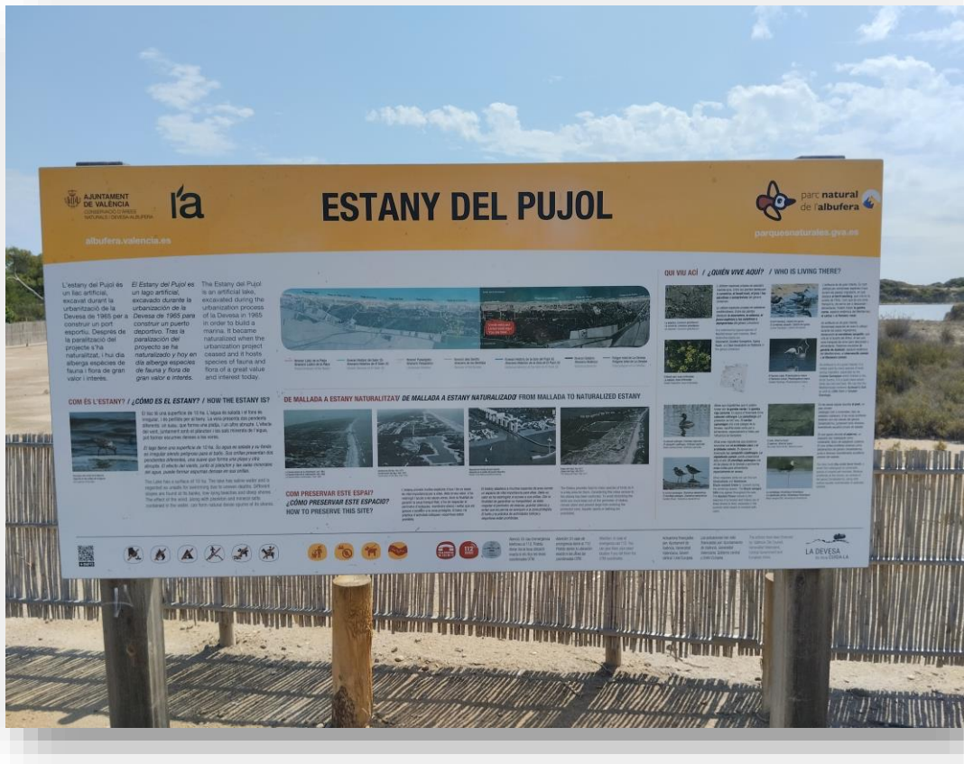
FOTO 5. Cartelería informativa del Parque Natural de la Albufera