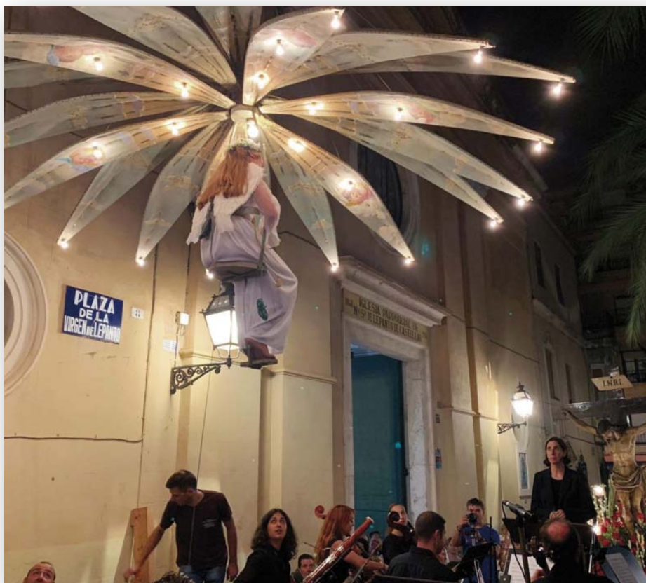
FOTOS 6 Y 7. Imagen histórica del “Cant de la Carxofa” y representación actual