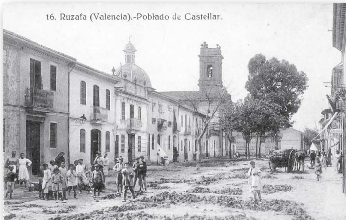
FOTO 1. La plaza principal de Castellar con la iglesia de Nuestra Señora del Rosario de Lepanto en 1921