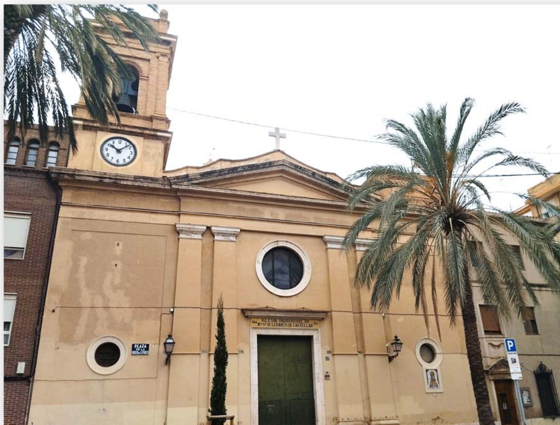
FOTO 2. Fachada principal de la iglesia en la actualidad.