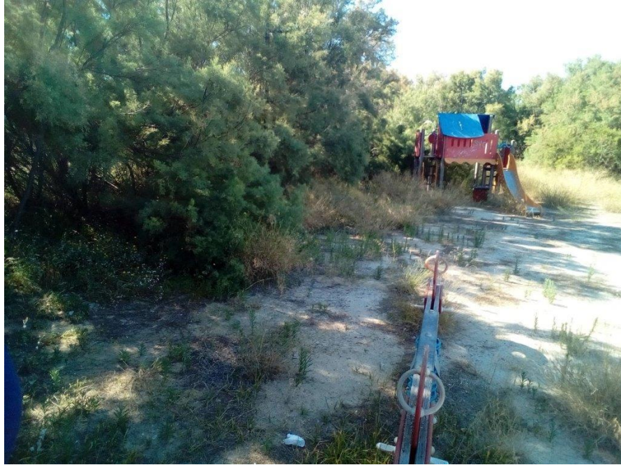
Parking carrer del Riu, junto a la playa. Zona lúdica para niños completamente abandonada y con evidente peligro para los niños.

Id. document: p24b 3d1e czh3 mm78 gMEQ KkIO SE4= CÒPIA INFORMATIVA (NO VERIFICABLE EN SEU ELECTRÒNICA)