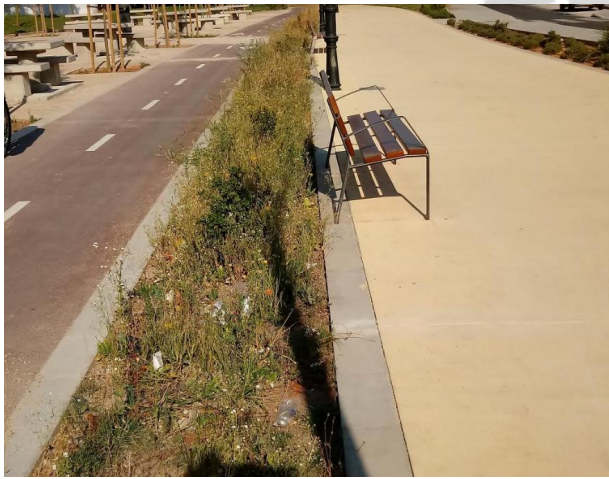
Vial de circulaci3n en Zona Estaci3n de FGV (Benimámet)

En esta moción, Ciudadanos Cs hace una revisión del estado de los parques y zonas ajardinadas correspondientes al ámbito geográfico de los barrios de la Junta de Distrito de Poblats de L'Oest, con el objetivo constructivo de resaltar defectos que pueden ser fácilmente resolubles permitiendo la mejora del entorno de nuestros vecinos.