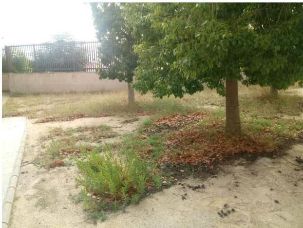
Parque de Camales (Benimàmet). En el parque de Camales se encuentra falta de limpieza, de recogida de hojas y de falta de poda en zonas de arbustos y arboleda.