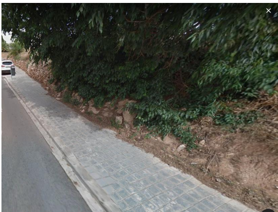
Muro ajardinado calle Liria (Beniferri)