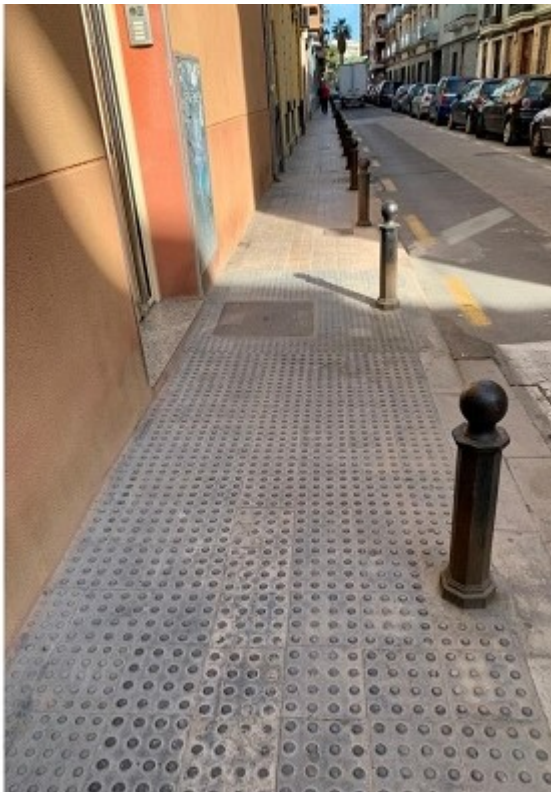
Calle Cerdá y Rico