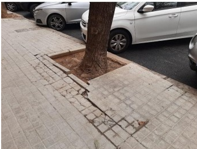
Calle Pintor Navarro Llorens