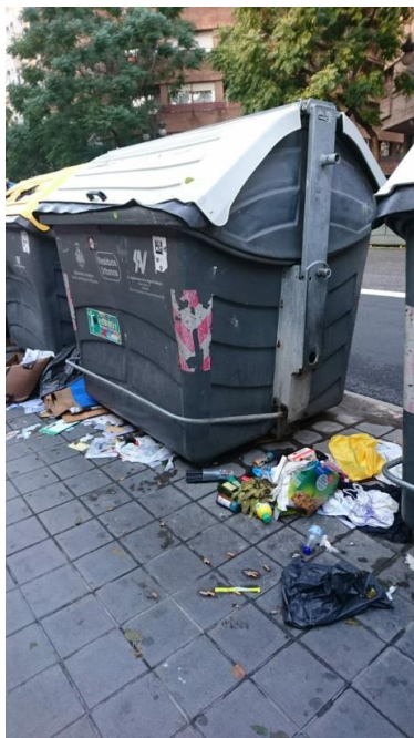
c/ Guillem de Castro