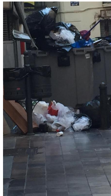
c/ Embajador Vich