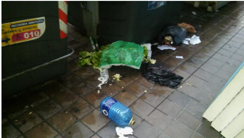
c/ Pascual y Genís